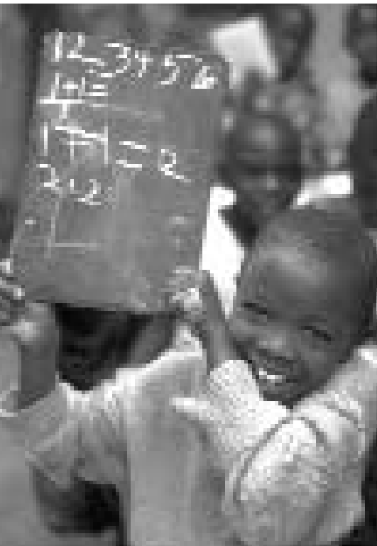
Im südlichen Afrika geht nur jedes zweite Kind zur Schule.

In den Ländern Afrikas südlich der Sahara gehen etwa 45 Millionen Kinder nicht zur Schule – das ist fast jedes zweite Kind. Nirgendwo sonst sind Kinder bei der Bildung so benachteiligt wie in Afrika. Besonders auf dem Land sind die Schulen oft überfüllt, schlecht ausgestattet oder einfach zu weit entfernt. UNICEF und die Nelson-Mandela-Stiftung haben deshalb die Aktion „Schulen für Afrika“ ins Leben gerufen. Ziel der Kampagne ist es, zwei Millionen Kinder in die Schule zu bringen. UNICEF hilft, einfache Schulen neu zu bauen oder instandzusetzen. Die Kinder erhalten Hefte, Stifte und weiteres Schulmaterial, UNICEF schult auch zusätzliche Lehrer. Die Dorfbewohner und die Lokalregierungen helfen mit und übernehmen Verantwortung für ihre Schulen – eine wichtige Voraussetzung für nachhaltige Hilfe.